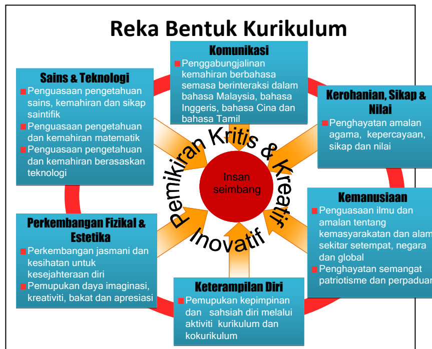
Rajah 1: Reka Bentuk Kurikulum KSPK dan KSSR

dan nilai. Disiplin ilmu dalam tunjang ini merangkumi Pendidikan Islam bagi murid Islam dan Pendidikan Moral bagi murid bukan Islam.